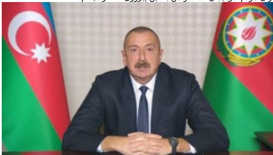
الهام علی اف

«امروز روز تاریخی برای مردم آذربایجان است و من به این پیروزی افتخار می‌کنم.»