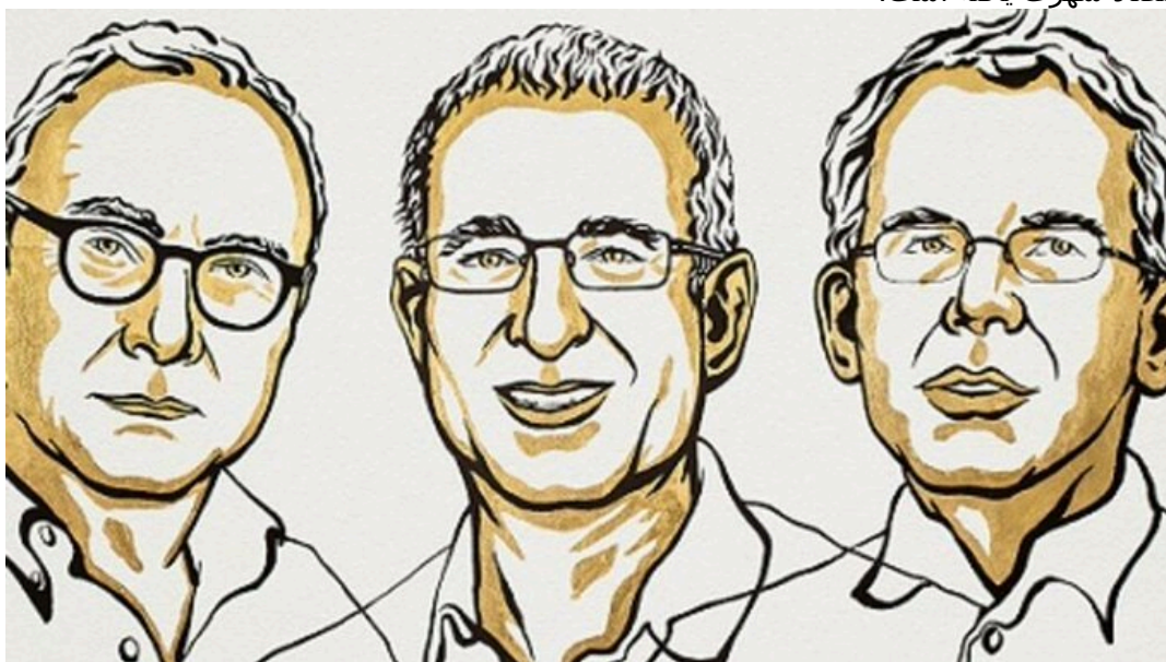
دیوید کارد، جاشوا انگریست و گویدو ایمینس

این جایزه از سوی بانک مرکزی سوئد (Riksbank Sveriges) در سال ۱۹۶۸ و به یاد آلفرد نوبل پایه‌گذاری شده و سپس به عنوان نوبل اقتصاد شهرت یافته است.