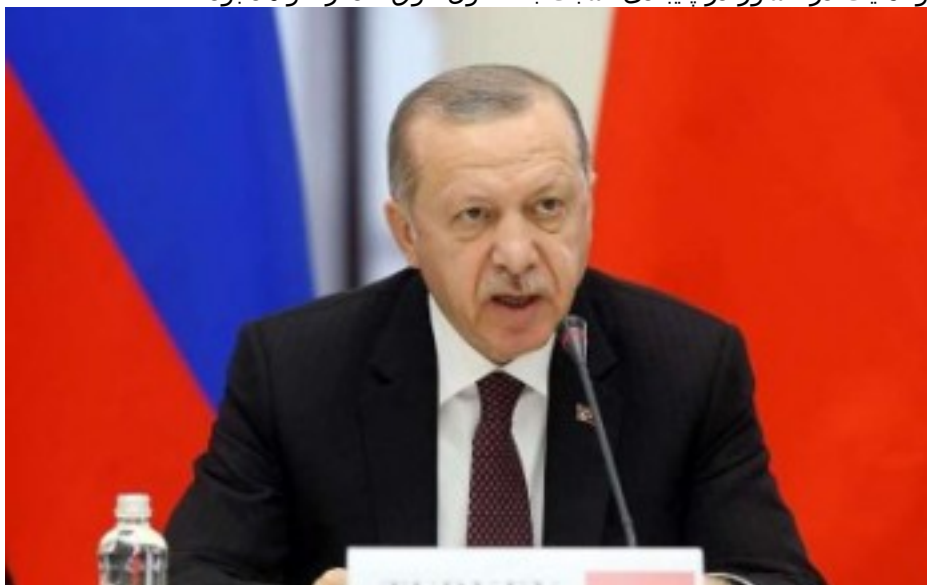
رجب طیب اردوغان

۵- در این زمینه، تصریح نمودند که تصمیم ایالات متحده مبنی بر خروج نیروهایش از سوریه، در صورت اجرا، گامی به منظور کمک به تقویت ثبات و امنیت در کشور در پایبندی نسبت به اصول فوق الذکر خواهد بود.