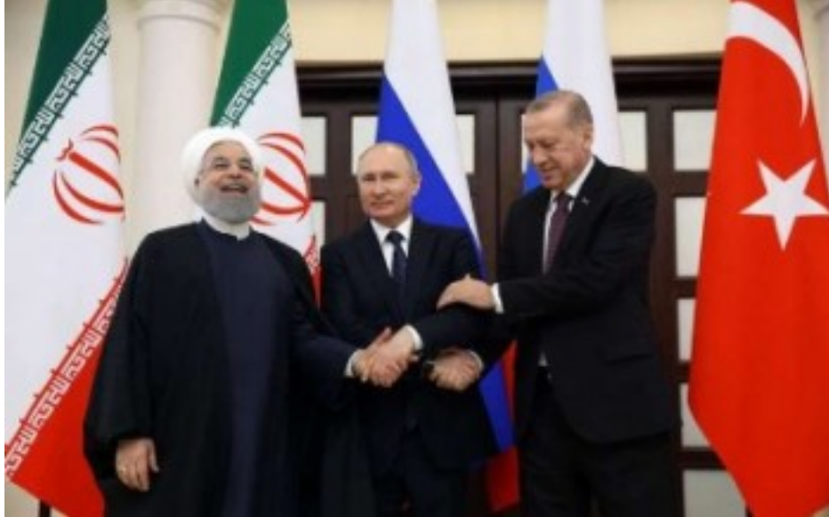
حسن روحانی، ولادیمیر پوتین و رجب طیب اردوغان

۹- بر عزم خود برای تسهیل راه اندازی کمیته قانون اساسی در اسرع وقت ممکن از جمله از طریق توافق بر سر ترکیب آن و نیز ارایه توصیه‌هایی برای تدوین آیین کار بر پایه فعالیت سه ضامن تاکید کردند. آنها در این راستا بر اهمیت ادامه تعامل و هماهنگی با طرفهای سوریه و فرستاده ویژه دبیرکل سازمان ملل در امور سوریه، گیر پدرسون، تاکید نمودند.