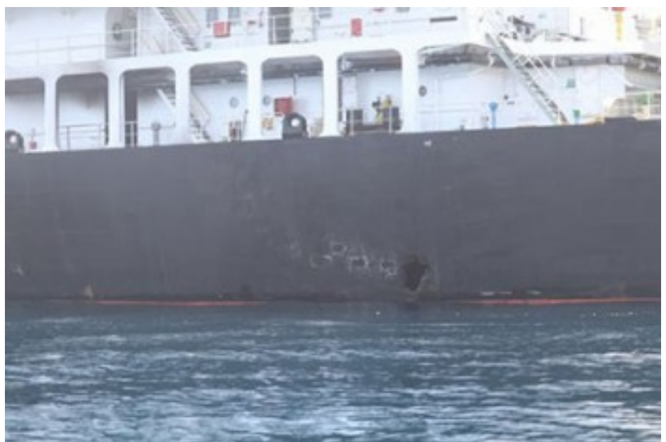
برچسب ها: خاورمیانه [1]